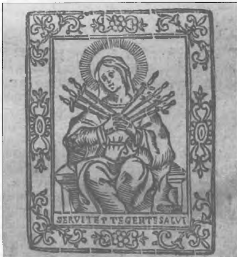
Porta caeli et vita aeterna Vrata nebeska i xivot vicchni (Ancona, 1678) knjiga I, str. 129.