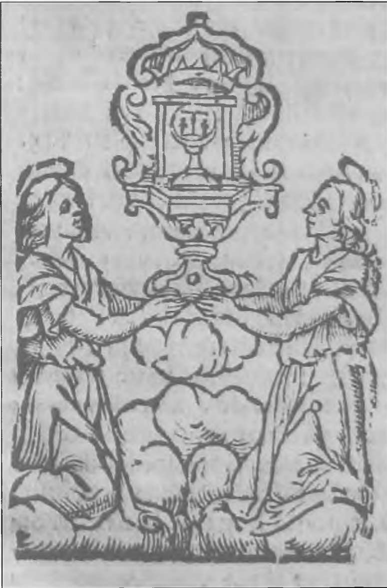
Porta caeli et vita aeterna Vrata nebeska i xivot vicchni (Ancona, 1678) knjiga II, str. 1.