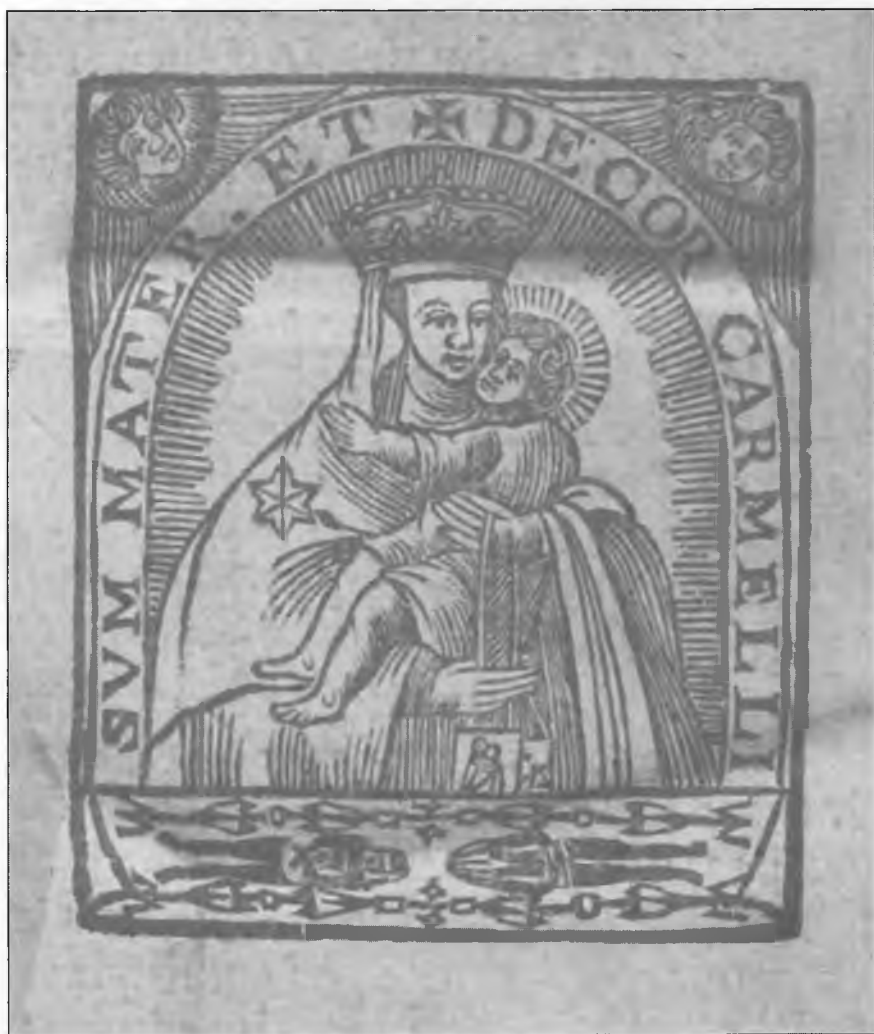
Porta caeli et vita aeterna Vrata nebeska i xivot vicchni (Ancona, 1678) knjiga I, str. XVIII.