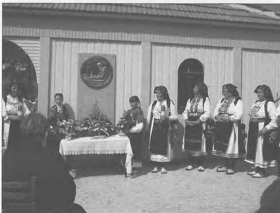
Otkrivanje spomen-medaljona na mjesnom groblju u Lipi.