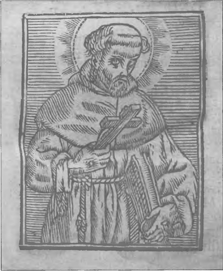
Porta caeli et vita aeterna Vrata nebeska i xivot vicchni (Ancona, 1678) knjiga I, str. XXXIV