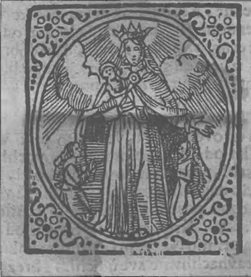
Slika iz Zdrave Marie, str. 100.