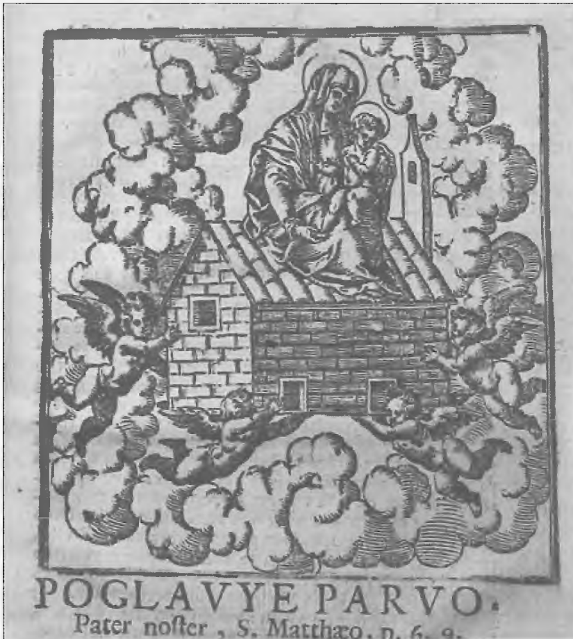
Porta caeli et vita aeterna Vrata nebeska i xivot vicchni (Ancona, 1678) knjiga I, str. 37.

Keywords: Latin citations, translations by Ančić, verb constructions, (Croatian) participles