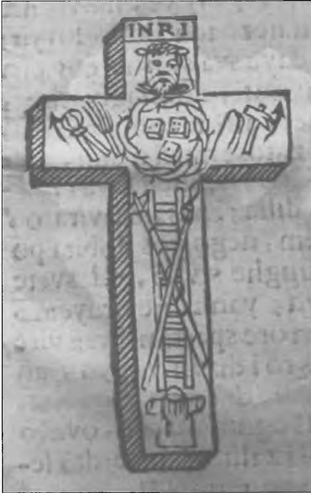
Porta caeli et vita aeterna Vrata nebeska i xivot vicchni (Ancona, 1678) knjiga I, str. 21