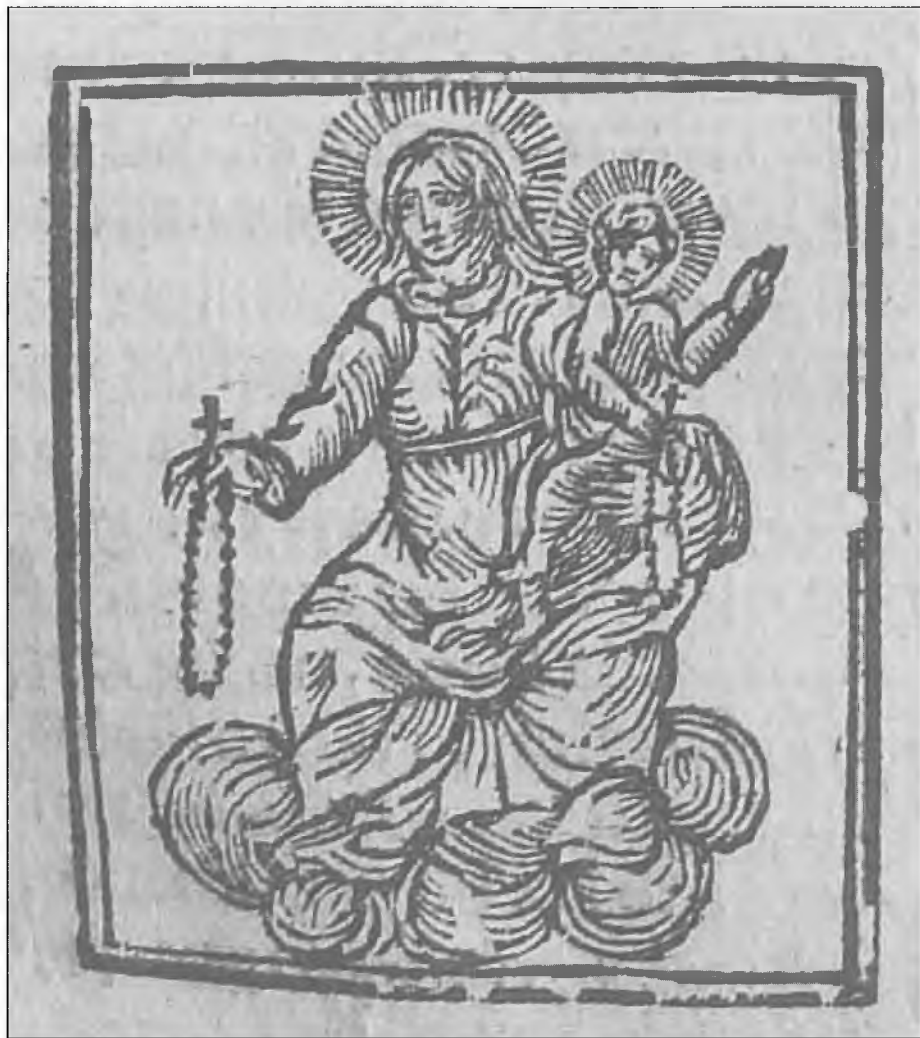
Porta caeli et vita aeterna Vrata nebeska i xivot vicchni (Ancona, 1678) knjiga II.

Keywords: Ivan Ančić, standardisation of Croatian, Neo-Shtokavian, 17th century